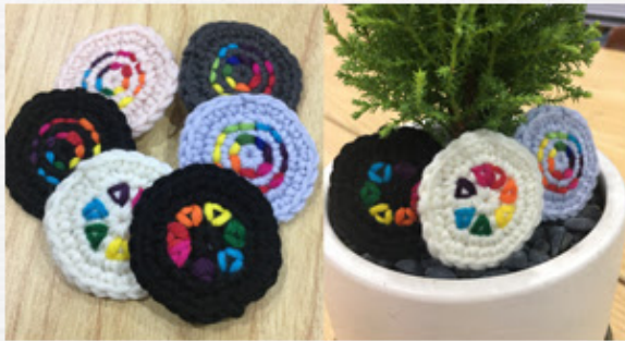
유아의 레인보우 피스 버튼