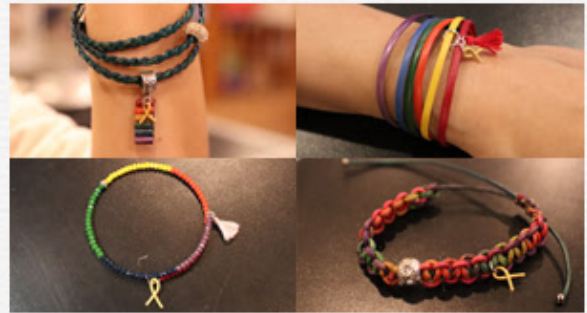
달그림자의 가족 수공예 팔찌

* 작년에 에코백을 놓치신 분들을 위해 23회 인천인권영화제 에코백을 준비해 두었습니다.