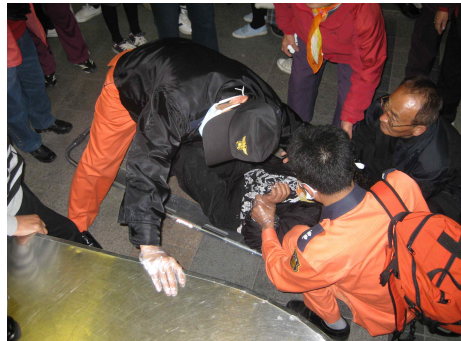
▲ 2008년 11월 15일 대구 동성로. 동성로는 대구의 명동 같은 곳이다. 저녁시간에 시민들이 지켜보는 가운데 해머까지 휘두르며 노점단속을 했다. 이날 용역들은 시민들의 거센 항의를 받고 쫓겨나 다시피 물러갔다.