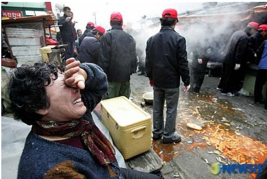
▲ 2008년 2월 22일 대구 두류종합시장. 강제철거과정에서 팔기위해 만들어 놓은 떡볶이가 땅에 버려지자 서러워 울음을 터트리고 있다. 자신의 생존이 땅에 내동댕이쳐진 것과 다름없기 때문이다.