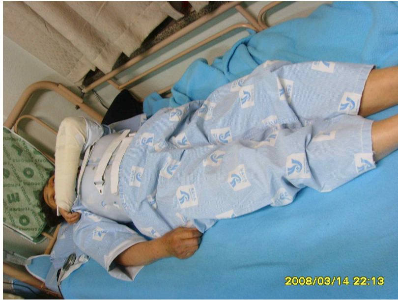
▲ 2008년 3월 75세 호떡 할머니. 신림동에서 장사를 하던 할머니는 몸이 아파 장사를 못하다 생활비가 없어서 어쩔 수 없이 장사를 나왔는데, 그날 관악구청에서 단속을 했다. 단속반원은 별로 저항하지도 않는 할머니를 심하게 뒤로 밀쳤고, 할머니는 12흉추 방출성 골절(척추 뼈가 내려앉음), 왼쪽 팔 골절이라는 중상을 당했다. 그러나 할머니를 밀친 구청직원은 다친 할머니를 방치한 채 물건만 싣고 가버렸다.