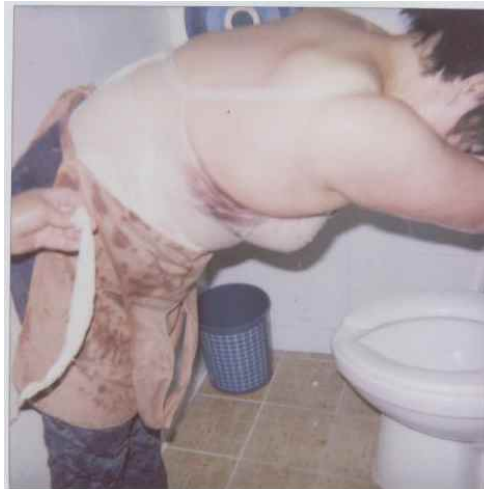
▲ 2005년 신촌. 손수레 4대 철거 과정에서 항의하는 노점상에게 용역반들은 튀김 기름을 들이 부어 화상을 입혔다. 이를 뒤 또다시 200여명의 용역들을 동원해 노인, 여성 가릴 것 없이 폭력을 행사하며 노점 수레를 강제 철거하였다.