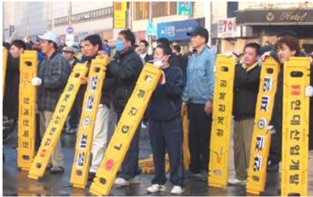
▲ 2003년 청계천행정대집행 때 하루 일당 4만원 받고 용역반으로 고용된 노숙인들. 이들은 부상당하더라도 아무치료도 못 받는다.

각 지자체별로 작게 3억, 많게는 31억 까지 어마어마한 예산을 책정해 용역업체를 고용한다. 용역업체는 일반적인 용역업체, 고엽제 전우회, 북파공작원 전우회, 장애인단체 등 각양각색이다. 그리고 이들 용역업체는 경호학과 대학생들, 노숙인 등을 아르바이트로 고용한다.