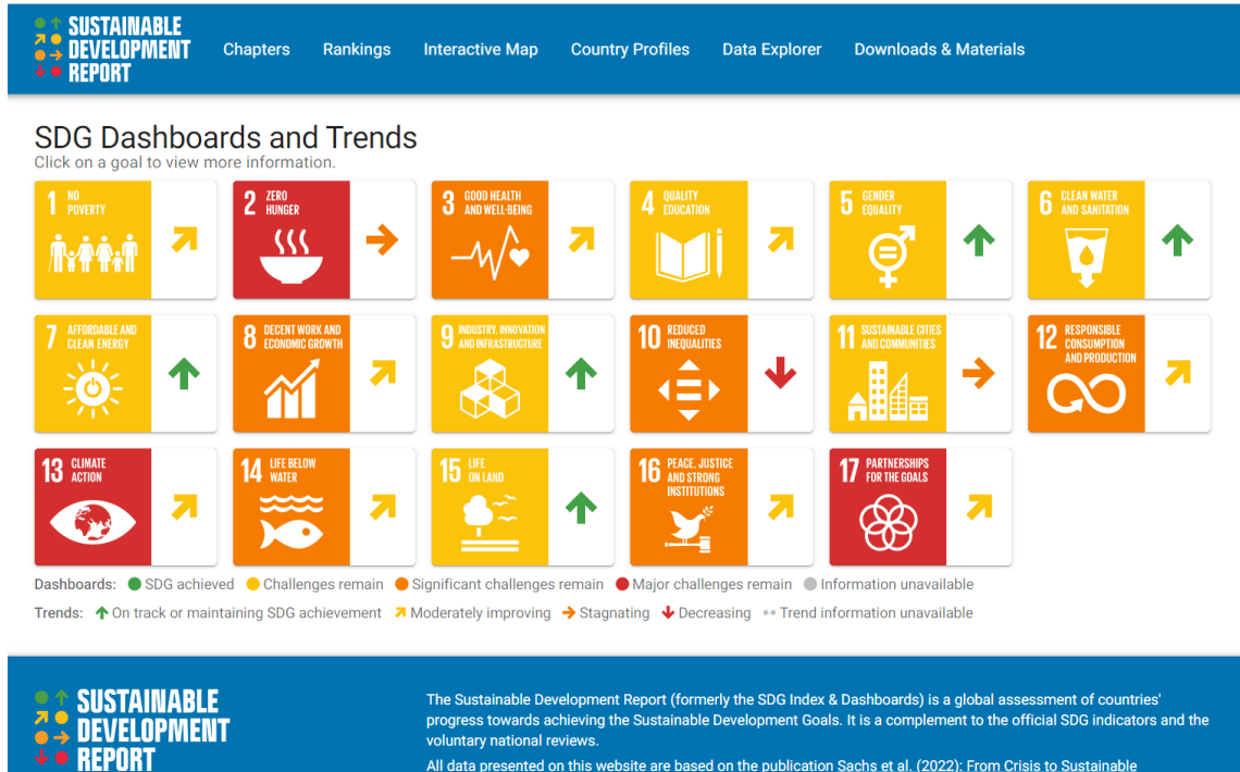
△ 영국의 SDGs 데이터 홈페이지 모습

그리고 조금 더 진행상황을 한눈에 파악할 수 있으면 좋겠다는 생각을 하다가 발견한 것이 영국의 SDGs 데이터 홈페이지였는데, 아래 화면과 같이 색과 화살표로 국내 이행 상황을 한눈에 인식할 수 있도록 표시하고 있었습니다.