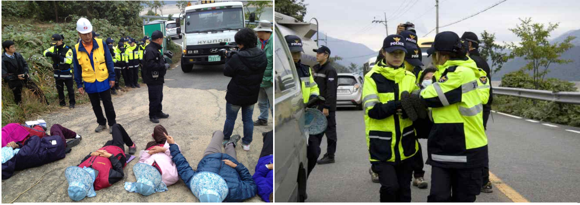
<탱크로리를 주민 앞으로 이동시키는 경찰(왼쪽), 주민들의 사지를 들어 옮기는 여경(오른쪽)>