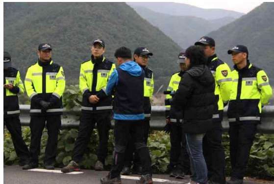
<경찰 사칭한 한전 직원에게 항의하는 미디어팀>