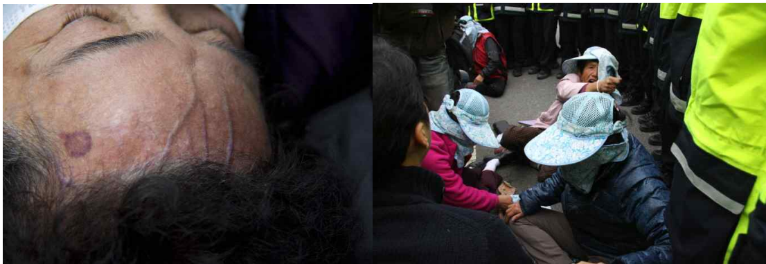
<이마를 다치고 쓰러지신 주민(왼쪽), 여경에게 갇혀 있는 주민 모습(오른쪽)>