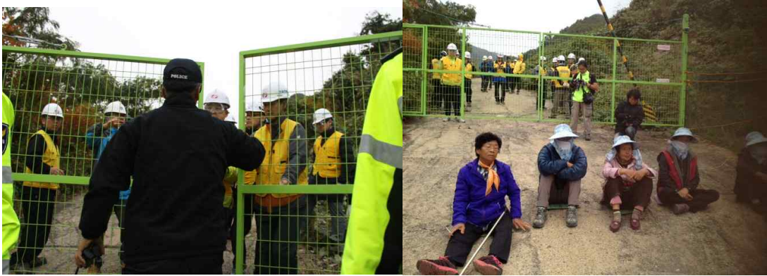
<한전 측 직원과 논의하는 경찰(왼쪽), 출입문 앞에 앉아있는 주민들(오른쪽)>