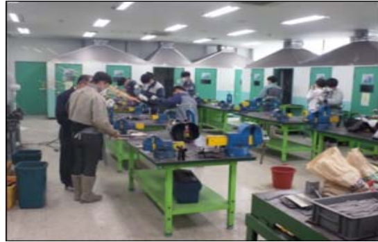
실습 중인 교사