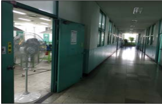
실습실 외부로 유해물질 확산·오염