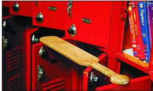
[그림 2] 노처럼 생긴 미국의 체벌도구

미국에서 체벌을 다른 말로 '패들링(Paddling, 노처럼 생긴 막대로 때리기)' 또는 '스팽킹(Spanking, 불기썩을 찰싹 때리기)'이라고 하는 것에서 알 수 있듯, 일반적으로 넓적한 판자 모양의 매로 불기썩을 때리는 방법을 사용한다.