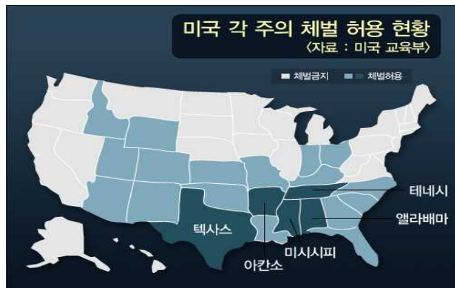
[그림 1] 미국 각 주의 체벌 허용 현황

아래의 지도에서 보듯이 주로 대도시 지역을 포함하는 북부권에서는 체벌을 금지하고 있는 가운데 정치적으로 보수적인 성향이 집중되어 있는 남부 지역의 교외 및 시골에서는 전반적으로 체벌을 허용하는 경향이 있다.