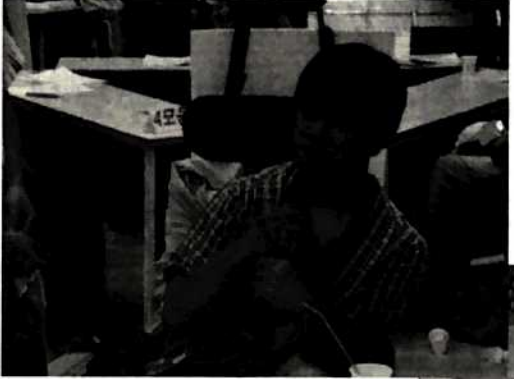
질문! 당사자의 관점으로 촌철살인의 화살을 날린다