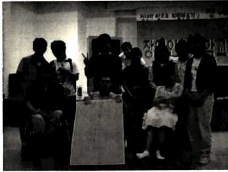
모듬별로 헤쳐 모여!