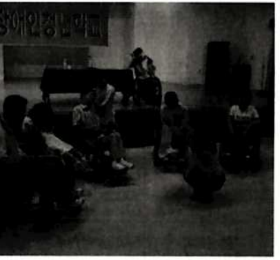
집단 발표-듣다, 말한다, 지켜본다, 함께한다