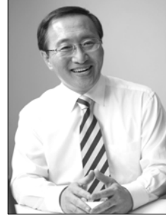
Ⅰ 노회찬 창원 성산구 국회의원, 정의당 원내대표

안녕하십니까, 경남 창원시 성산구 국회의원이자 정의당 원내대표인 노회찬입니다.