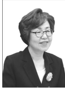
■ 권미혁 국회 보건복지위원, 여성가족위원