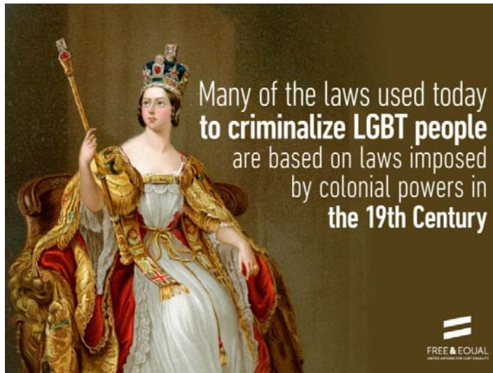
이러한 악법들이 사실은 열강 제국에 의해서 도입된 것임을 알리는 유엔의 인포그래픽

범죄화는 성소수자에 대한 대표적인 인권 침해 문제이다. 이 범죄화는 인권위반적인 법률에 기반하므로 비자의적 구금의 문제, 신체의 자유 침해 등이 문제되며, 신체 및 정신 건강 등 직접적인 사회권 문제도 발생한다. 또한 적극적으로 집행되지 않는다 해도 이 법률에 의한 성소수자 집단에 대한 사회적 낙인의 문제 또한 심각하기 때문에 규약상의 권리를 온전하게 보장받기 어렵다는 문제가 지적되었다.