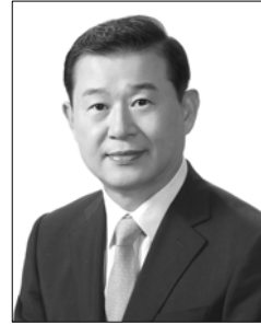
ㅣ 이성호 국가인권위원회 위원장