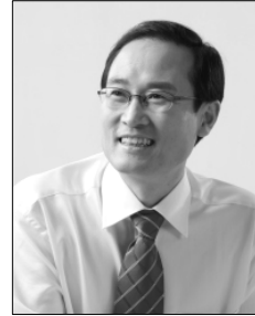
ㅣ 홍영표 국회 환경노동위원회 위원장 / 더불어민주당 국회의원